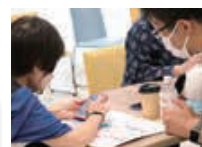
スマートフォン教室