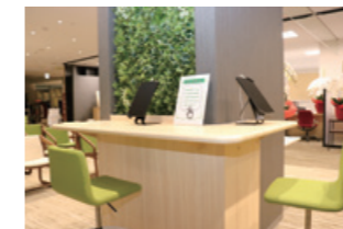
デジタルお手続きが体験できるタブレットカウンター