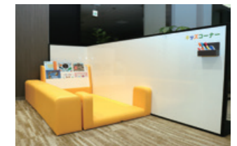
お子さま連れにもご安心いただけるキッズコーナー