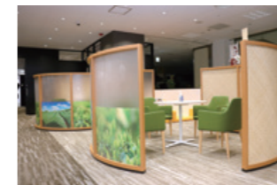
名産の狭山茶の茶籠と茶畑をイメージした相談ブース