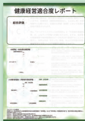
簡易診断イメージ