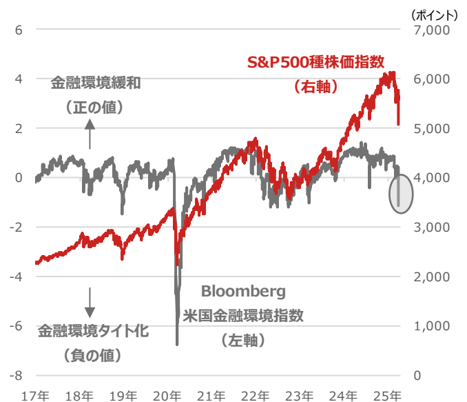
Bloomberg米国金融環境指数とS&P500種株価指数

・米相互関税発表後2営業日の累計下落率は2025年4月2日終値と同4日終値を比較 ・2025年高値比下落率は2025年の高値と2025年4月4日終値を比較 ・世界株（除く米国）はMSCI All Country World Index ex USA（米ドルベース）、SOXはフィラデルフィア半導体株指数