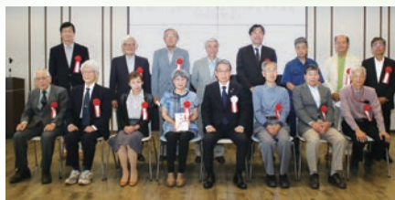
2022年度助成金贈呈式

助成先の募集は、例年10月1日(土日祝日の場合は翌営業日)から12月中旬まで行われます。その後、2月に開催される運営委員会にて厳正な審査が行われ、助成先と助成金額が決定し、4月下旬に助成金の給付が行われます。