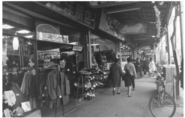
銀座通り商店街（1964年）