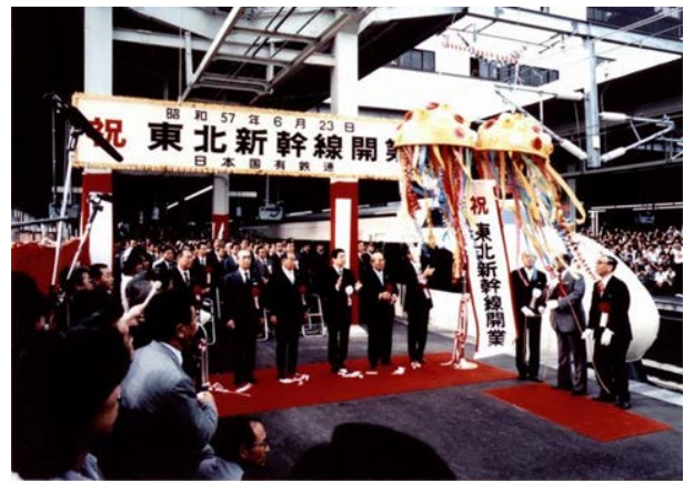
東北新幹線開通式（1982年）