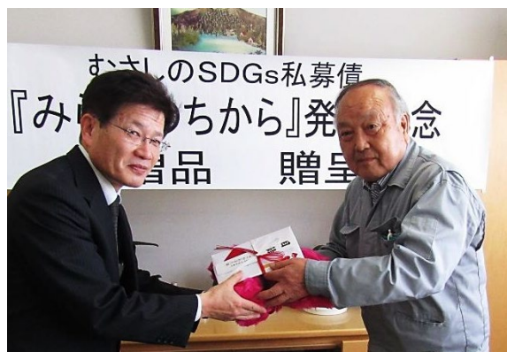
(左)鶴飼校長 (右)新藤社長