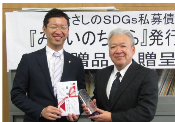
(左)會田専務 (右)永岡校長