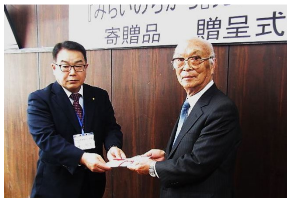
(左)峰校長 (右)古郡社長