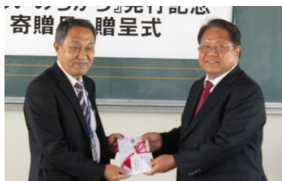
戸井田校長(左)、河上社長(右)