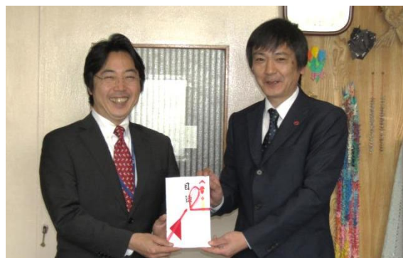
大森校長(左)、四方代表取締役(右)

別途、1社から寄贈を行っておりますが、寄贈先の希望により非掲載とさせていただきます。